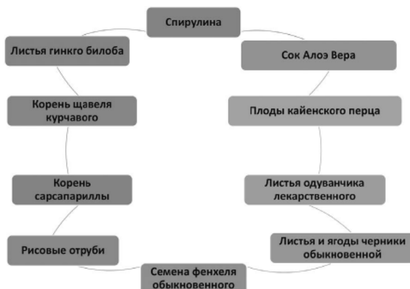
Рис. 2. Растительные продукты в составе витаминно-минерального комплекса Витабаланс 2000. Рекомендации по применению: по 1 таблетке в день во время еды. Продолжительность приема — не менее чем 1 месяц